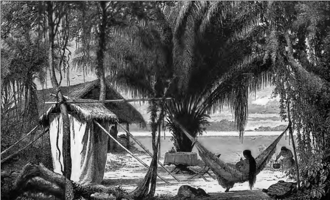
Figura 3. Estabelecimento recente de um barracão para o comércio de borracha às margens do rio Madeira. Fonte: Keller[-Leuzinger] (1874).

Keller[-Leuzinger] (1874), contratado pelo governo brasileiro, que viajou pelo rio Madeira, em 1867, com o objetivo de projetar a estrada de ferro Madeira-Mamoré, relatou e ilustrou (Figura 3) a crescente ocupação das margens do rio Madeira por empreendedores e migrantes nordestinos à procura de novas áreas para a produção de borracha: