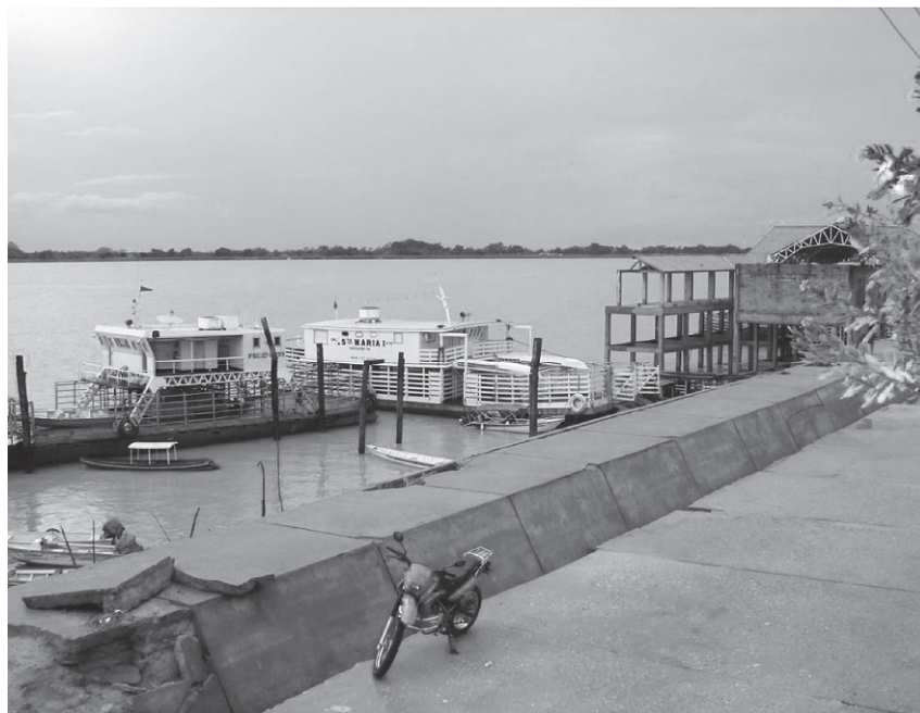
Figura 3. Cidade-floresta em tempo de seca do rio (Óbidos-Amazônia-Brasil)