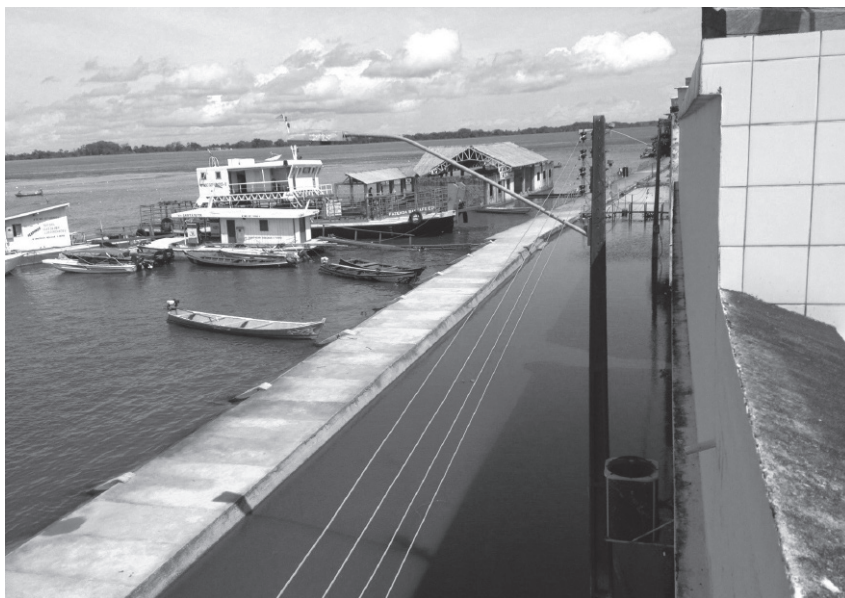
Figura 2. Cidade-floresta em tempo de cheia do rio (Óbidos-Amazônia-Brasil)