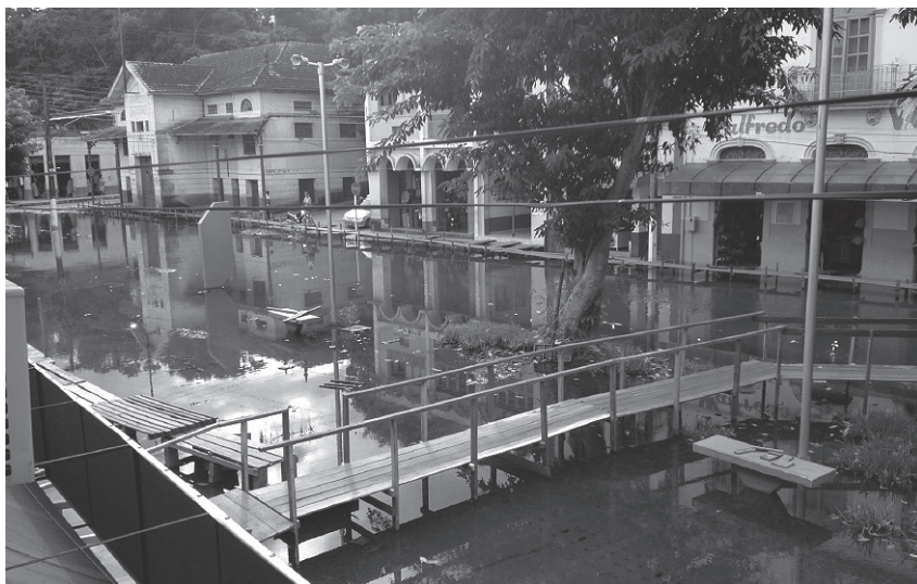
Figura 1. Exemplos de marombas em tempos cheia do rio (Óbidos-Amazônia-Brasil)