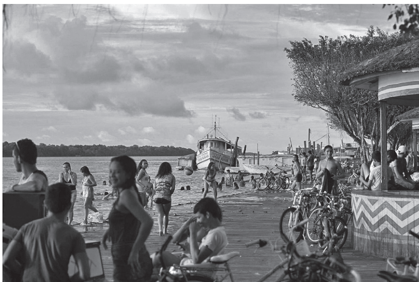
Figura 7. Interações comunicacionais e a integração homem-natureza (Afuá-Amazônia-Brasil)

Por estas dinâmicas, fica claro que, “[...] para além das visões míticas e discursos ambientalistas, a Amazônia é habitada por populações milenares, que aprenderam a conviver com a natureza que se impunha a sua volta” (Monteiro e Colferai, 2011, p. 38).