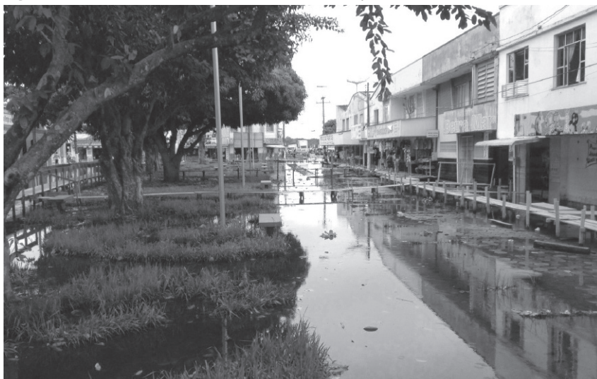
Figura 5. Caminhos de marombas que evidenciam interações (Óbidos-Amazonia-Brasil)