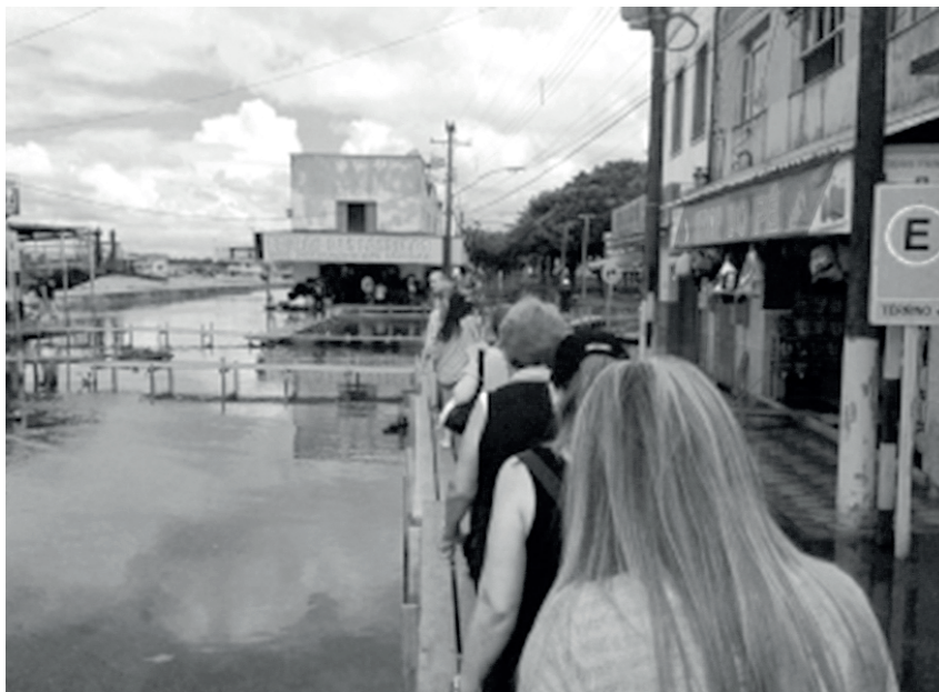
Figura 4. Caminhada sob as águas em tempos cheia dos rios (Óbidos-Amazônia-Brasil)

Fonte: Acervo pesquisadores (junho de 2013)