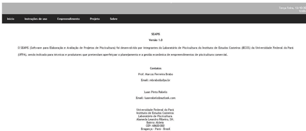
Figura 7 - Aba "Sobre" do Menu do SEAPIS ( Software para Elaboração e Avaliação de Projetos de Piscicultura) Contendo Informações sobre os Profissionais que Desenvolveram o Programa e seus Respectivos Contatos.