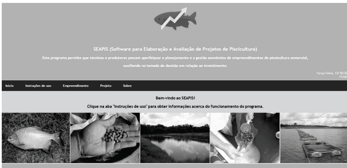
Figura 1 - Tela Inicial do Programa SEAPIS ( Software para Elaboração e Avaliação de Projetos de Piscicultura), Contendo o Menu com as Abas “Início”, “Instruções de Uso”, “Empreendimento”, “Projeto” e “Sobre”.